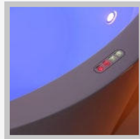
PAINEL DE CONTROLE TOUCH