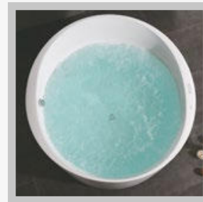
250 MINI JETOS EMBUTIDOS