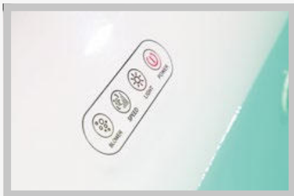
PAINEL DE CONTROLE TOUCH