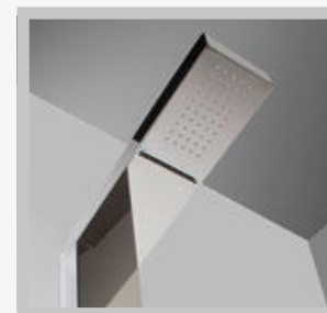
CHUVEIRO E CASCATA