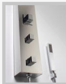
JATOS E DUCHA MANUAL