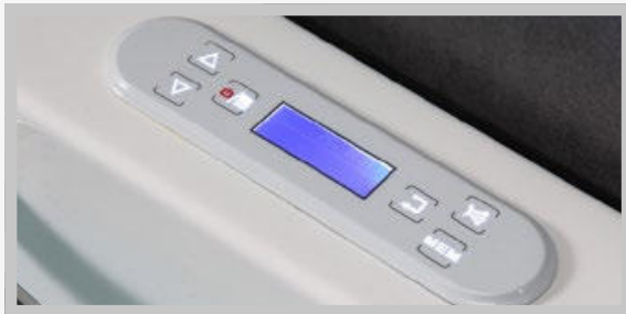
PAINEL DE CONTROLE DIGITAL