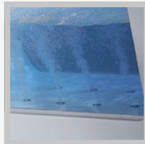
SISTEMA BOTTOM HYDROMASSAGE